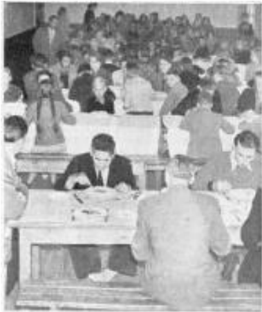
Lehrer und Schüler versammeln sich zu den Mahlzeiten im großen Ess-Saal des Internates. Litauer in Übersee sorgen durch regelmäßige Spenden für den Unterhalt der Schüler

Litauens Wappen-Patron St. Georg auf weißem Ross schmückt alle Räume der Schule und steht über ihrem regen Leben. Die Schüler, die weder für Schulgeld nach Unterhalt, noch Kleidung zu sorgen brauchen — etliche von ihnen sind Waisen —, halten ihr kleines Reich selbst in Ordnung und pflegen den Garten. Die schwedische Spende einer kompletten Korbball-Ausrüstung gab der Schule Gelegenheit, zu sportlichen Ehren zu kommen. Im großen Ess-Saal sehen wir alle versammelt. Es fällt auf, dass den Fremden alle Kinder grüßen, und wir bewundern im Stillen die Einheit von Unbefangenheit und Respekt, das schlechten Lehrern stets unerreichbare Ziel. Bei den Lehrern sitzt ein stolzer Feriengast, einer der ersten Studenten, die von der Schule kommen. Er studiert Naturwissenschaften in Bonn und war auch bei der Abordnung der Schule zur Welttagung der Pfadfinder in Österreich; denn mit den Pfadfindern steht die Schule auf freundschaftlichem Fuß. Beide Konfessionen werden in ihrem Glauben unterwiesen.