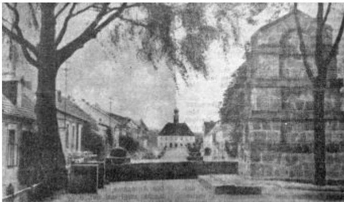
Ein Bild aus Angerapp Es zeigt das Kriegerdenkmal, die Kirchenstraße und das Rathaus

Vom Deutschen Haus in Richtung Rathaus war eine Markthalle errichtet, in welcher täglich Markt abgehalten wurde. Der größte Markt war am Sonntag. Es wurden außer sämtlichen Lebensmitteln auch alle anderen Waren feilgeboten. Alle Kaufläden und Betriebe waren verstaatlicht, die Angestellten hatten eine Arbeitszeit von acht Stunden. Sonntags waren sämtliche Betriebe, Läden und Büros geschlossen. Auf dem Turm der Post befand sich ein Rundfunk, der ununterbrochen von morgens 6 bis abends 10 Uhr laut und weit hörbar spielte. Ed. Fischer