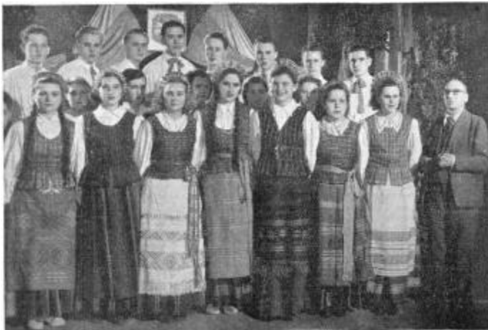
An besonderen Feiertagen tritt der Chor des Litauer-Gymnasiums bei Diepholz in Nationaltracht auf die Bühne. Die Trachten sind noch Privateigentum der Mädchen.

Damals, 1950, lebten noch über 100 000 Litauer in Westdeutschland und es spricht für die dynamische Kraft ihres Volkstums, dass sie in vielen ihrer Lager Volksschulen und Gymnasien einrichteten. Sie sind inzwischen nach Übersee gegangen, ein kleiner Rest aber blieb in Deutschland. Leben diese letzten 8000 im ganzen Bundesgebiet verstreut, so denken sie doch nicht daran, ihr geistiges Eigenleben aufzugeben. In alten Kasernenräumen bei Diepholz setzen ihre Lehrer den Zeigestock auf die Karte Litauens, aber auch auf mathematische Demonstrationen. Draußen tönt das lustige Geschrei vom Sportunterricht. In den Stuben des Internats breiten Mädchen litauischfarbene Gewebe über die Tische. Etwa 120 Mädchen und Jungen leben hier und werden unterrichtet vom ersten Grundschuljahr bis zum Abitur. So entstand hier für die kleinste Gruppe eines fremden Volkes ein Werk echter Kulturautonomie.