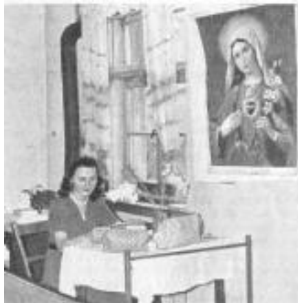
Die Zimmergenossinnen haben dem Geburtstagskind einen kleinen Gabentisch geschmückt. Das Madonnenbild an der Wand erinnert an die Heiligenbilder des Ostens, die Symbole der tiefen Religiosität der Ostvölker

Die Lehrer, vierzehn an der Zahl, sind gastfrei und nicht nur unverbindlich höflich, sondern herzlich. Einige haben in Deutschland studiert, einer in Königsberg. Wir stellen uns die gleichen Fragen: Wie sieht es in Ostpreußen aus, wie in Litauen? Sie haben kaum Verbindung nach ihrer Heimat hinüber; unsere Heimkehrer aus Litauen sind ihre Nachrichtenquelle wie die unsere. Von Königsberg sprechen wir, von der Nehrung, dann von den Göttern der alten Prußen, von denen sie viel wissen. Wir ließen unsere Dankbarkeit nicht unerwähnt für die Hilfe, die unsere Landsleute in Litauen erfuhren; sie machen kein Aufhebens davon. Es ist mehr als alte Nachbarschaft und gleiches Schicksal, was hier verbindet. „Es gibt ein paar, die hetzen noch“, sagte einer der Lehrer zu unserem Verhältnis, „als hätten sie nichts gelernt“. Das ist es: Gemeinsame Zugehörigkeit zu denen, die mit letzter Gründlichkeit belehrt wurden, und darin gemeinsame Verantwortung. CK